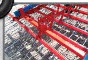
Regolazione inclinazione del dente